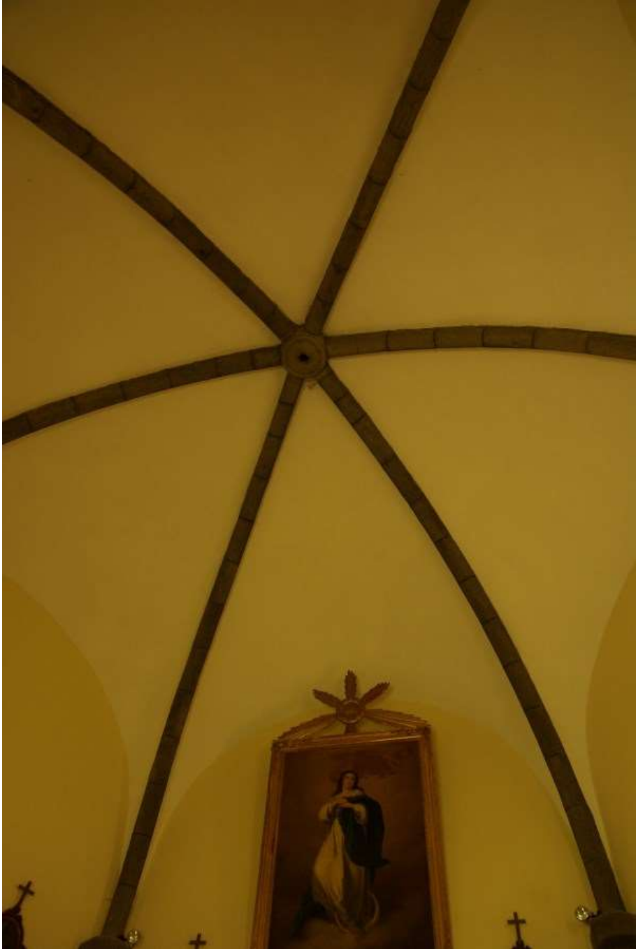
Le plafond hexagonal de Notre-Dame d'Auteyrac