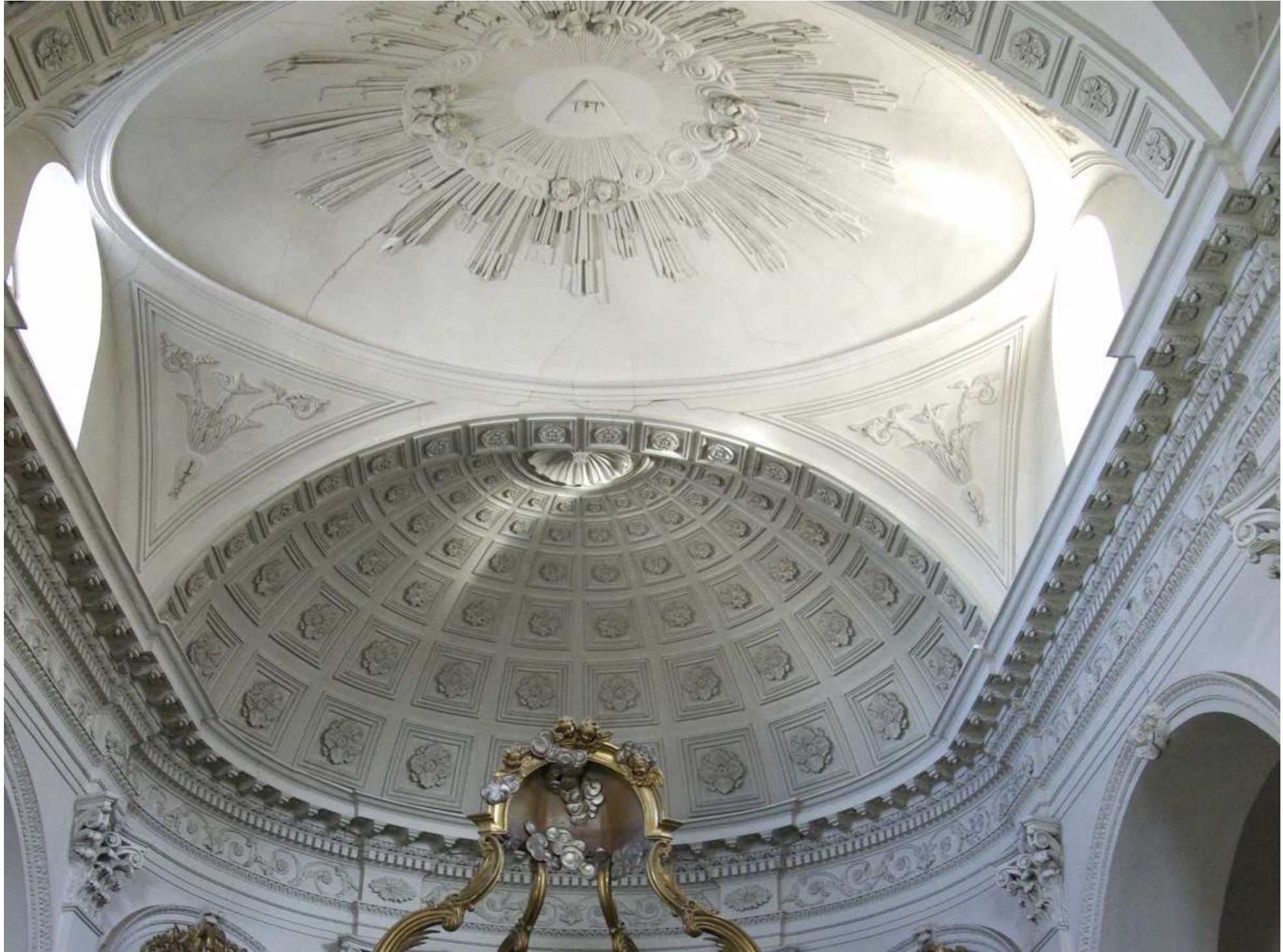
Un Beau travail sur le stuc. Chapelle de la Visitation au Puy